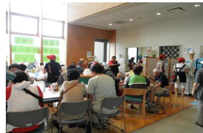
▲ おびった1F 喫茶店「パストラル」