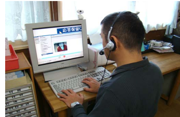
▲ パソコン操作風景