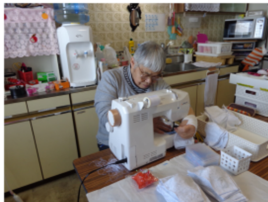
マスク作りに一生懸命

台所付きの超狭い部屋で、しかも納期が迫っているのにミシンの調子が悪かったりと、いろいろありながらも、とにかく要請された枚数をこなさなければ...と思い、一生懸命ミシンを動かしました。一日も早く多くの子供さん達にお届けしたい気持ちで一杯です。今回は、旭川市内の小学生用を作りました。(A・M)