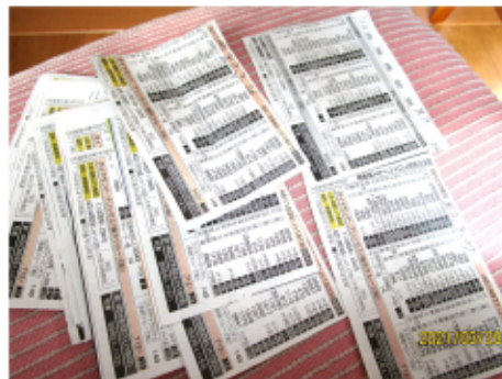
道新、切り抜き抜粋

全国の新型コロナウイルス感染者数を見るのが日課になっている今日この頃。左記の表は道新から抜粋したものです。一時期はその数が減ったかのように思われたが、最近再び、グッと拡大しつつなので、なんじゃこれって感じですが不安がつきまわっています。政府は躍起になって、この数を減らそうとあれこれ対策を講じているようですが一向に減らないのは何故?