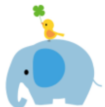
ガウン作りに一生懸命